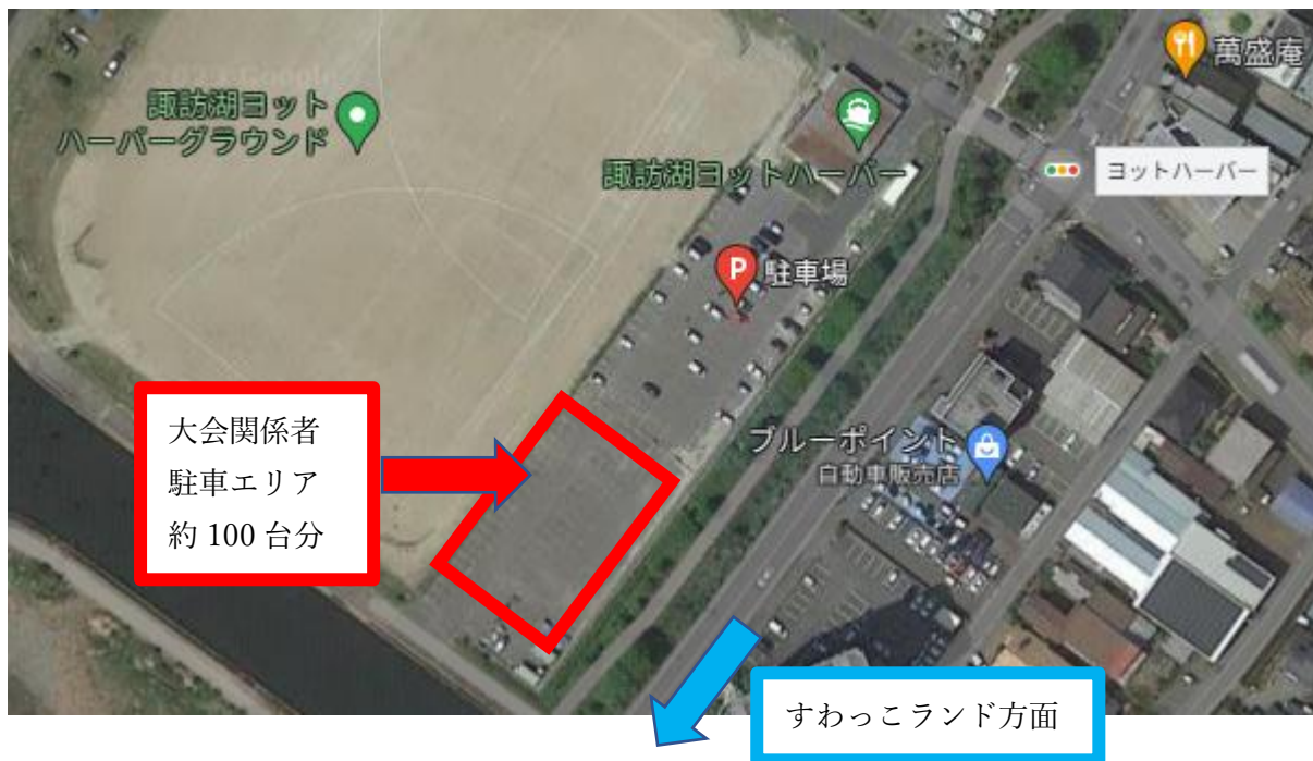
(2) 諏訪湖ヨットハーバー駐車場奥側